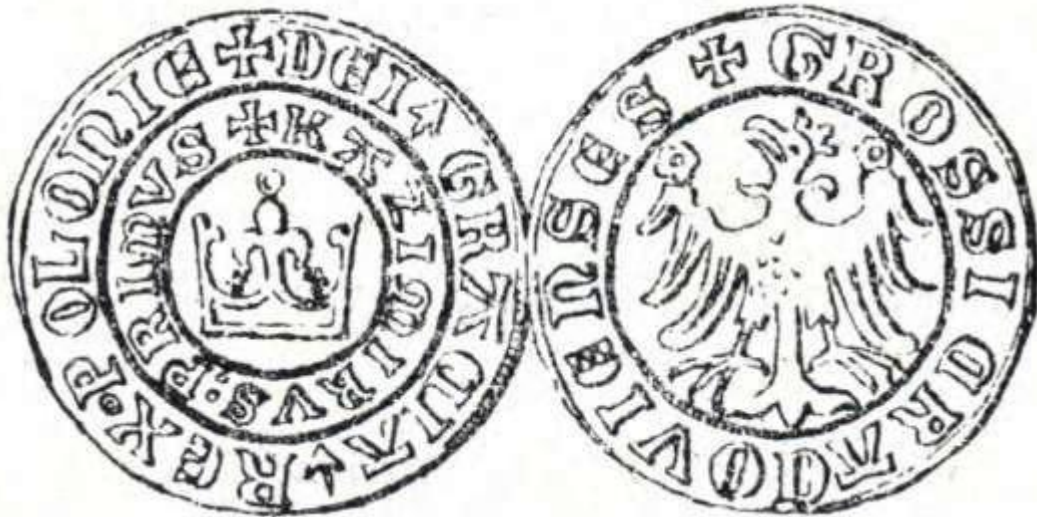
K. Stronczyński „Dawne monety polskie” 1885r.

Zapoznaj się z poniższym rysunkiem i odpowiedz na pytania: