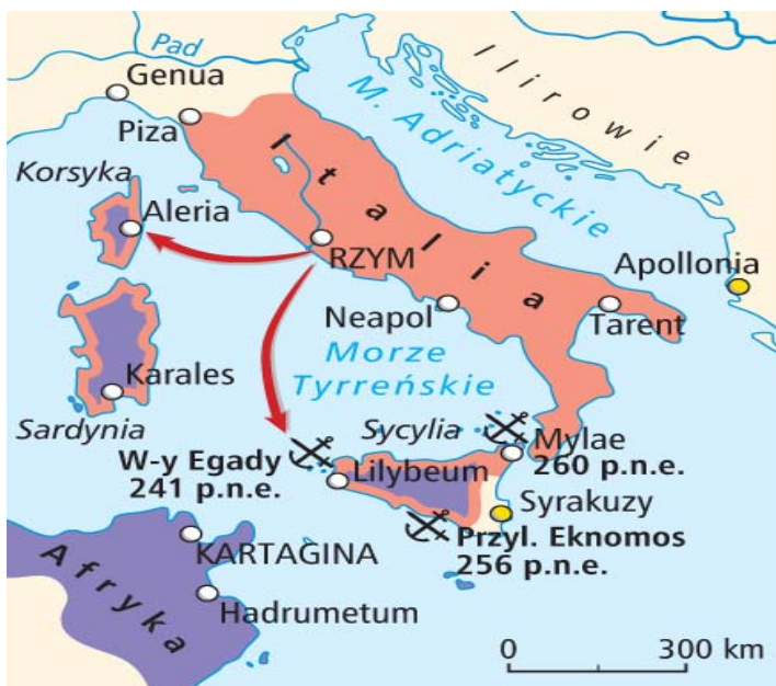
(Mapa pochodzi z multimedialnych zasobów wydawnictwa „Nowa Era”)